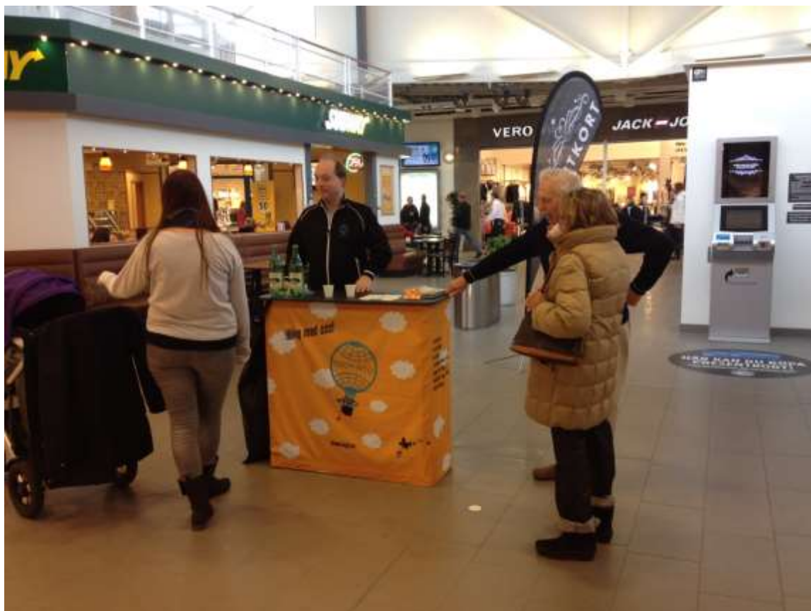
Värkning i Uddevalla

Glöm inte att fotografera era träffar och aktiviteter, dessa bilder använder vi till Profilen bland annat. Skicka gärna in dem till mig!