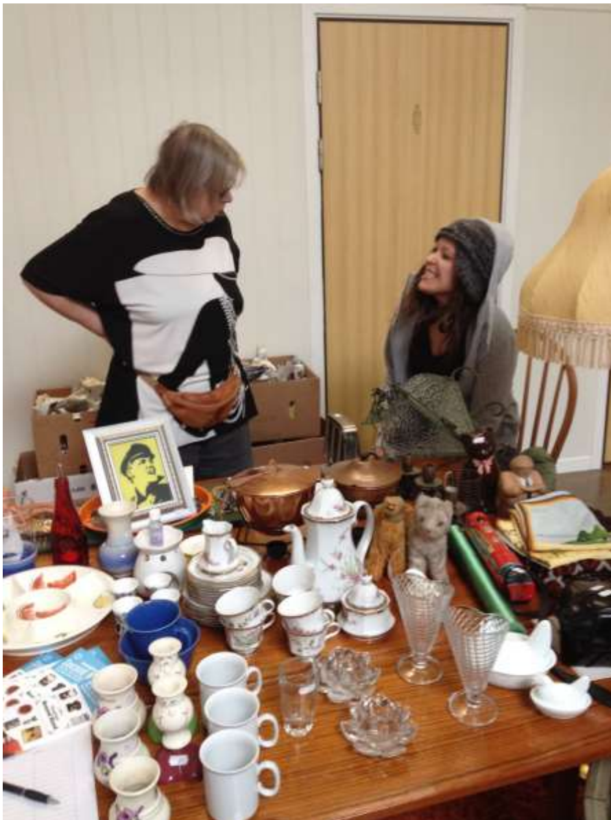
Vännplatsens Miniloppis på Distriktsårsmötet

För kontakt och information, vänligen hör av dig på 0705-971366 eller info@vannplatsen.se . Besök deras hemsida: www.vannplatsen.se